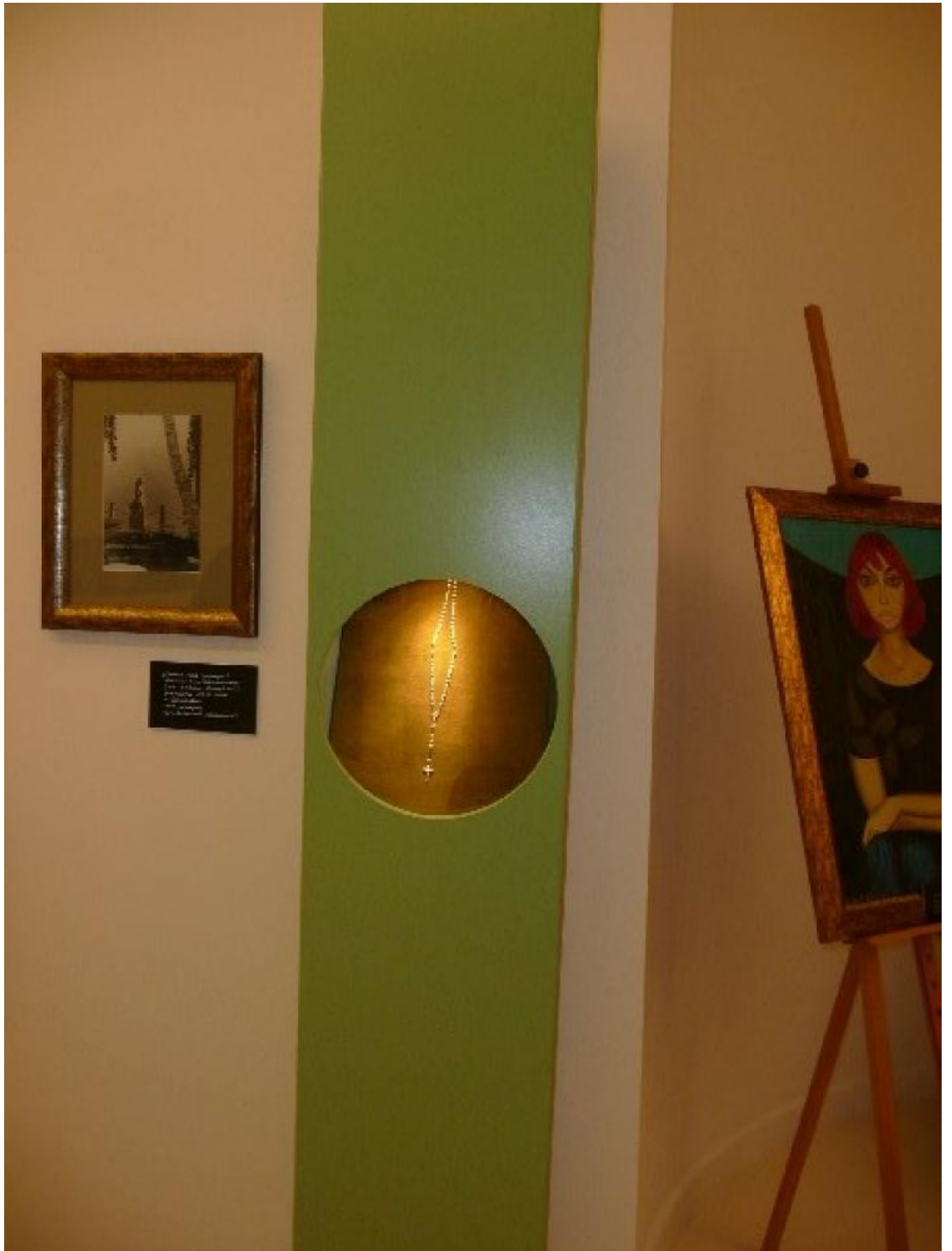
Portrait of a woman by the artist 1950s oil on canvas 100 x 100 cm